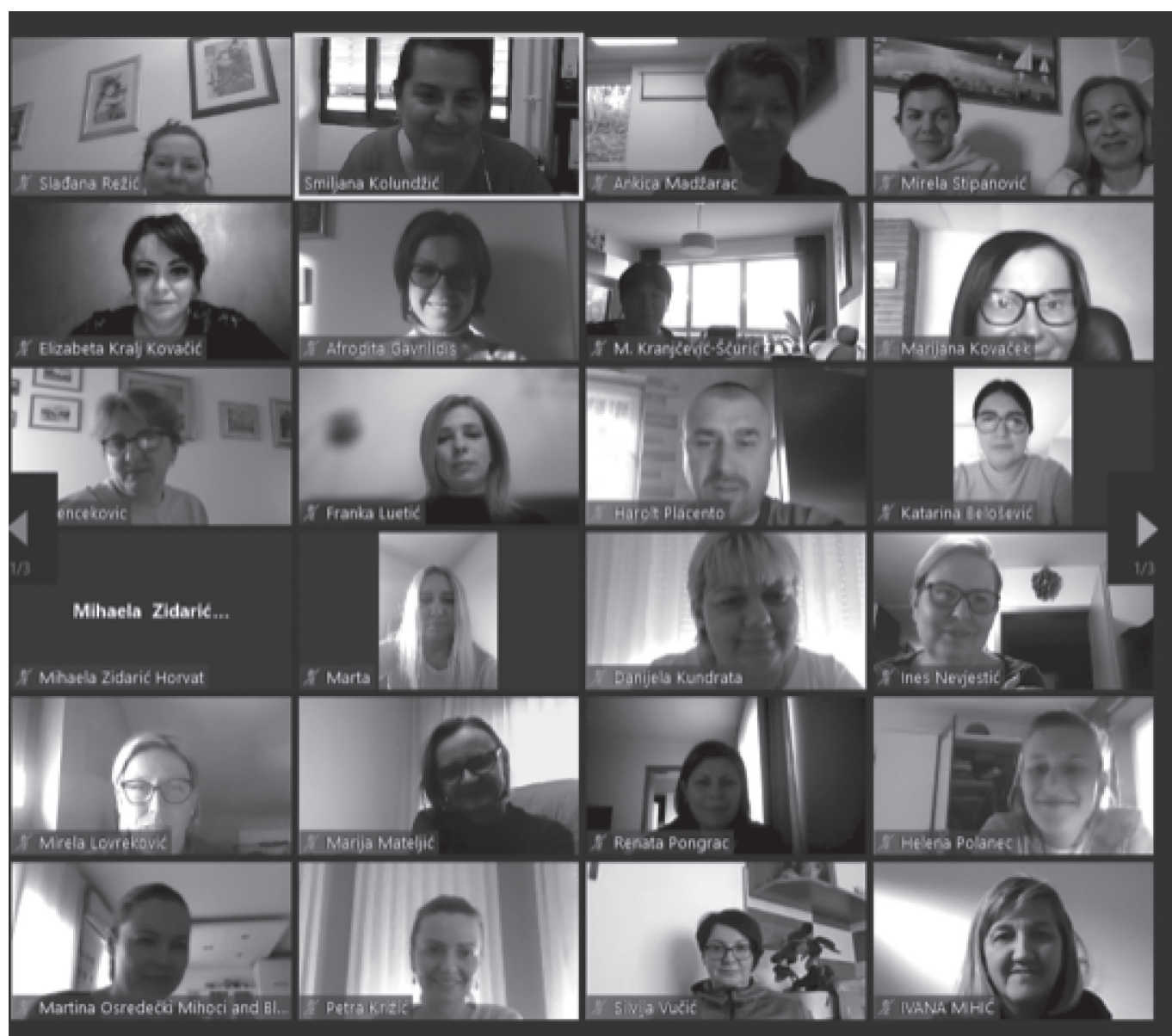
SLIKA/FIGURE 1. Sudionici tečaja temeljne edukacije Društva za kvalitetu, 19. 3. 2022. / Participants of the basic education course of the Society for Quality, March 19, 2022