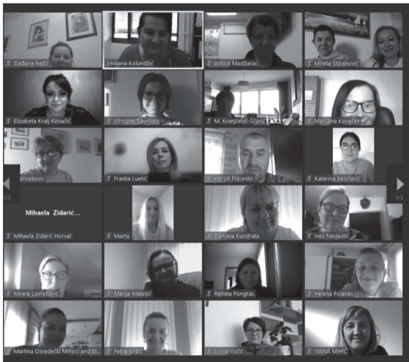
SLIKA/FIGURE 1. Sudionici tečaja temeljne edukacije Društva za kvalitetu, 19. 3. 2022. / Participants of the basic education course of the Society for Quality, March 19, 2022