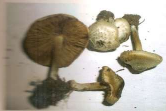
opisano - smrtno otrovna gljiva

Muhara ( Amanita Muscaria ) i srodne gljive koje sadrže iboteničku kiselinu i muscimol uzrokuju otrovanje koje oponaša akutnu alkoholnu intoksikaciju (panterinski sindrom). Simptomi se